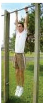
Posição Inicial (1)

b) execução: flexionar simultaneamente os braços até ultrapassar o queixo acima da barra horizontal (2); retornar a posição inicial (1), pela extensão completa dos braços; posição final (3). Realizar, nessas condições, o maior número de flexões de braço, até o limite da resistência do candidato. O repouso é permitido, na posição (1), devendo o candidato ser avisado a respeito. O comando para iniciar a prova será dado pelo avaliador.