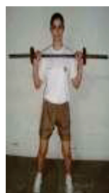
Posição Inicial (1)

a) posição inicial: de pé, pernas afastadas, barras suspensas até a altura dos ombros, com pegada na posição de rosca inversa, e abertura lateral no alinhamento dos ombros. (1); e b) execução: estender totalmente e simultaneamente os braços para cima. (2); voltar à posição inicial (1) pela flexão completa dos braços. (3); realizar, nessas condições, o maior número de extensão e flexão de braços, até o limite da resistência do candidato, sem executar movimentos de flexão de pernas ou qualquer outro movimento que impulse para cima os halteres, além dos braços. O repouso é permitido, na posição (1), devendo o candidato ser avisado a respeito. A barra deverá pesar 6 kg, ter 1,20m de comprimento e até 25mm de espessura, compondo, o conjunto de duas anilhas de 2 kg cada, totalizando 10 kg. O comando para iniciar a prova será dado pelo avaliador.