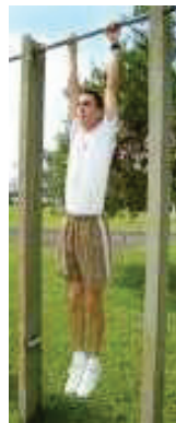
Posição Final (3)

1.1.2 Os cotovelos devem estar em extensão total para o início do movimento de flexão.